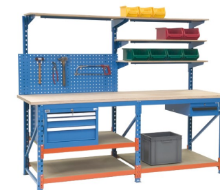
Tables et postes de travail