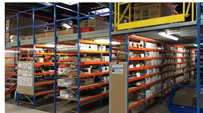
Magasins à étages