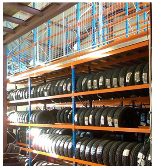
Stockage de pneus