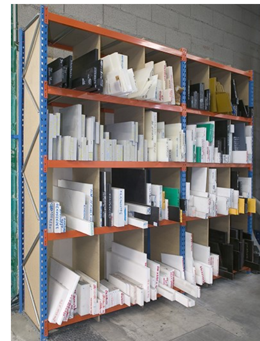
Casiers en bois aggloméré