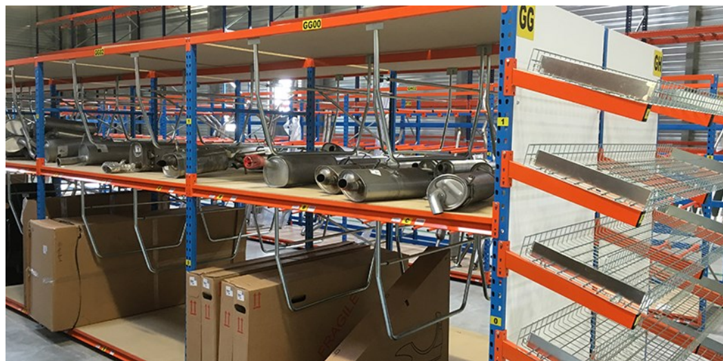
Rayonnage mi-lourd équipé de séparateurs tube et goulottes de picking

LA VARIÉTÉ DIMENSIONNELLE DE SES COMPOSANTS LUI DONNE UNE GRANDE ADAPTABILITÉ D'UTILISATION.