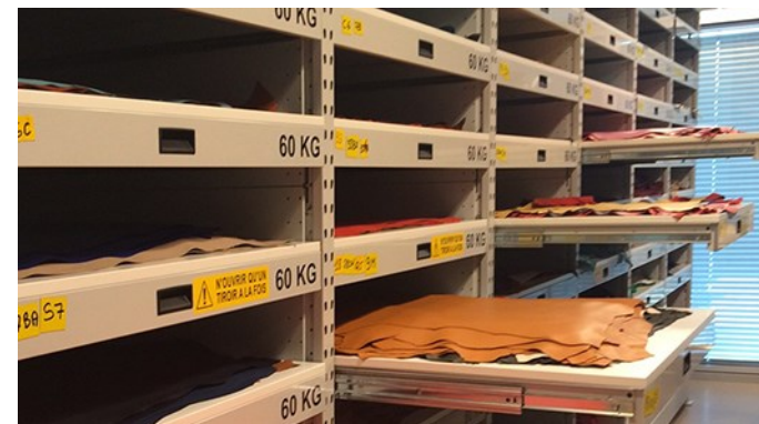
Meubles à tiroirs pour le stockage de cuirs