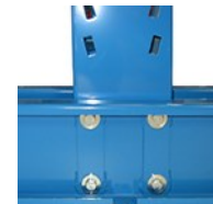
Détail fixation du montant sur la base