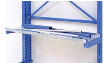
Goulotte en tôle galvanisée pour le stockage de chutes