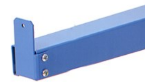
Butée en bout de bras H : 50 et 100 mm