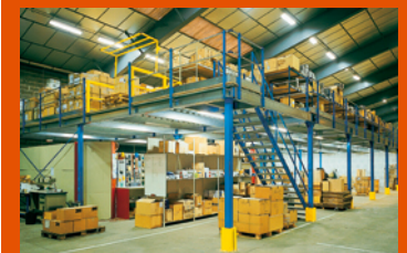
PLATE-FORME DE STOCKAGE