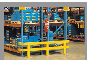
EQUIPEMENT / MANUTENTION