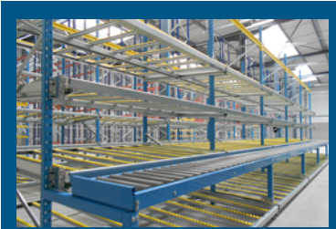
DYNAMIQUE BACS / CARTONS