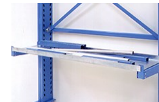
Goulottes en tôle galvanisée pour le stockage de chutes