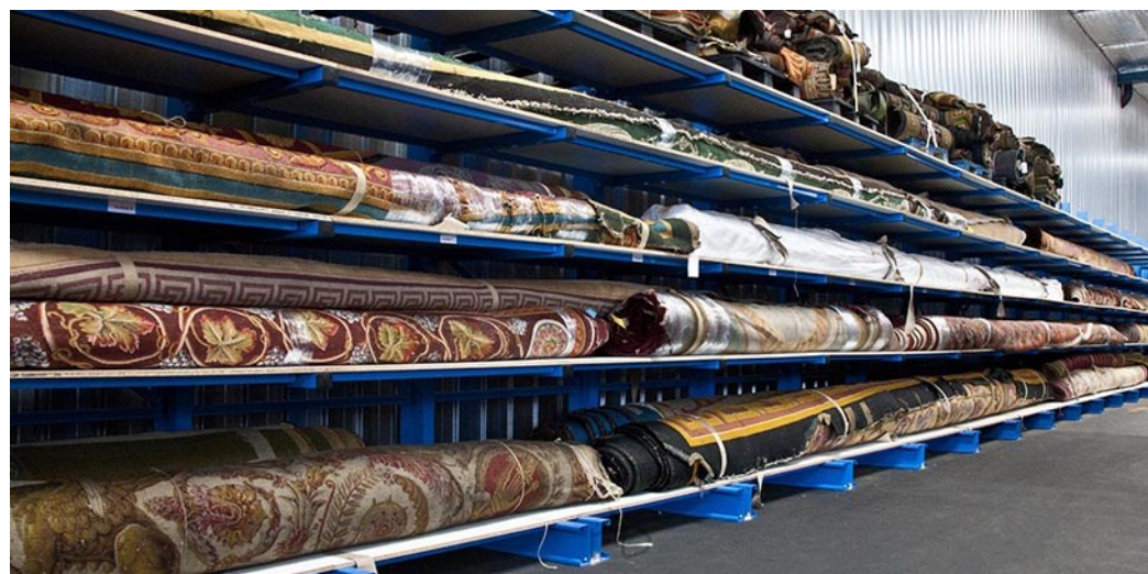
Stockage de tapis sur le rayonnage PROFILBAR simple face

C'EST LA SOLUTION IDÉALE POUR L'ENTREPOSAGE DE PRODUITS LONGS DE 3000 A 6000 MM , EN MAGASIN, AU SEIN D'UN SERVICE MAINTENANCE ET PARTOUT OÙ L'OPTIMISATION DE LA SURFACE DE STOCKAGE ET L'ORGANISATION DE VOTRE SITE NÉCESSITE UN MATERIEL FIABLE, ÉCONOMIQUE ET ROBUSTE.