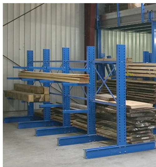
Stockage de planches et tasseaux de bois