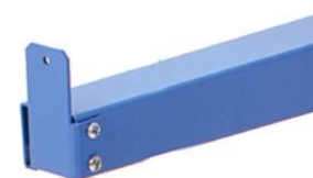
Butée en bout de bras H : 50 et 100 mm