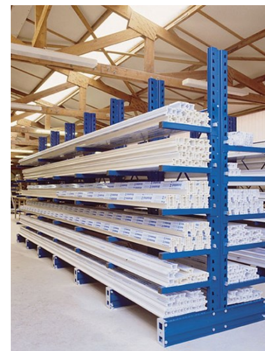
Stockage de profilés PVC sur un double face