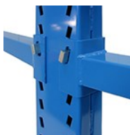
Détail accrochage du bras support