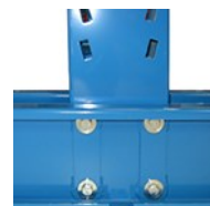
Détail fixation du montant sur la base