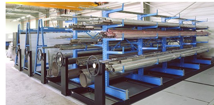
PROFILBAR installé sur des bases mobiles

LE MAS DES ENTREPRISES 5, AVENUE LIONEL TERRAY 69330 MEYZIEU TÉL 04 37 42 65 65 info@gravittax.fr - www.gravittax.fr