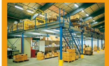
PLATE-FORME DE STOCKAGE