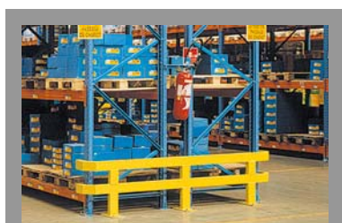
EQUIPEMENT / MANUTENTION